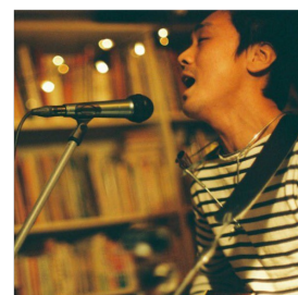
住職の甥です 素敵な時間を ご一緒に